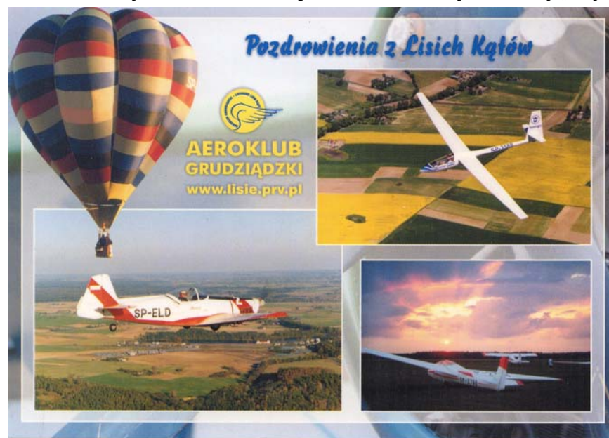
Pocztówka z 2005 Wydawnictwa PWR